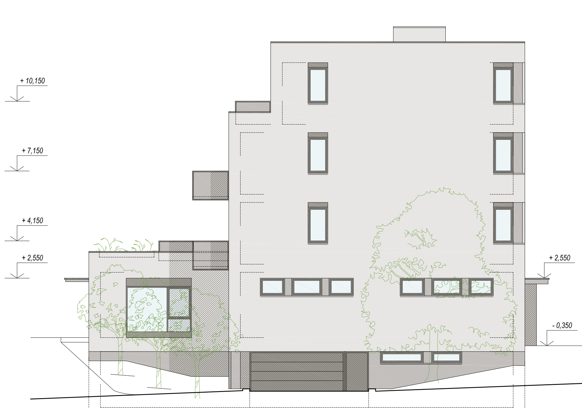
POHLED VÝCHODNÍ A ZÁPADNÍ, 1:100 SO 2 - BYTOVÝ DŮM